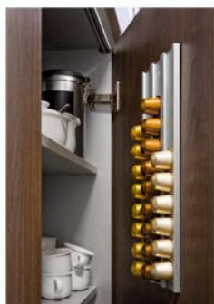
Fijación en puerta de armario

Fijación mediante adhesivo o alcayatas (incluidos)